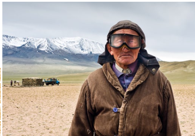
«Nomad kazakh» ©Alexander Rawlins

Ecole Normale Supérieure Le Carré 45 rue d'Ulm Paris 5e